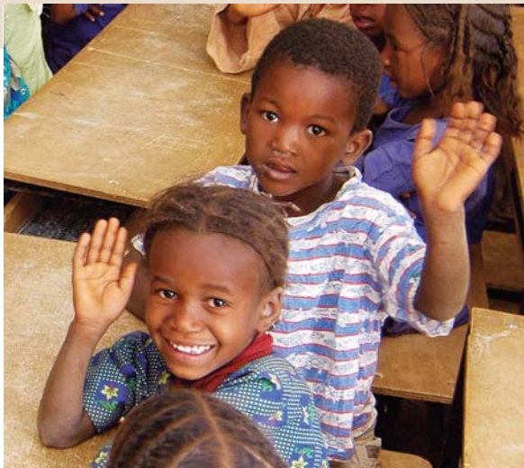
CARE / Christine Harth