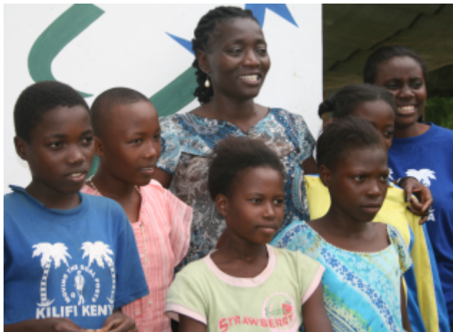
CARE-Projekt Koordinatorin Auma Obama