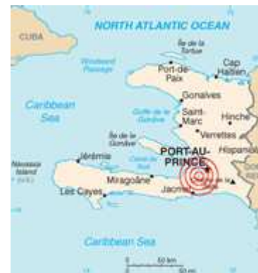
Die Erdbebenregion in Haiti 2010.