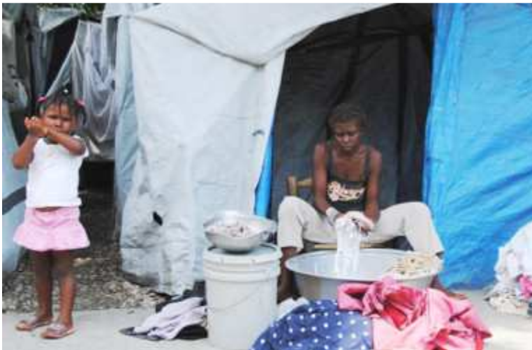
Noch immer wohnen hundertausende Haitianer in Zelten.