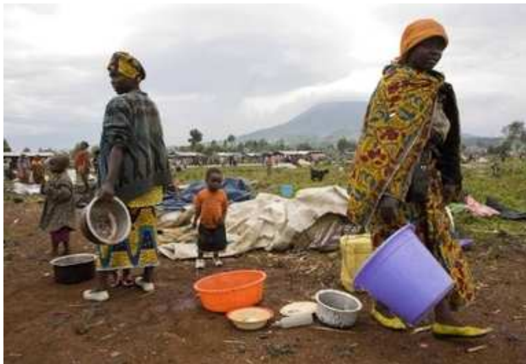
Bis zu 100.000 Menschen verlassen die umkämpfte Region im Kongo.