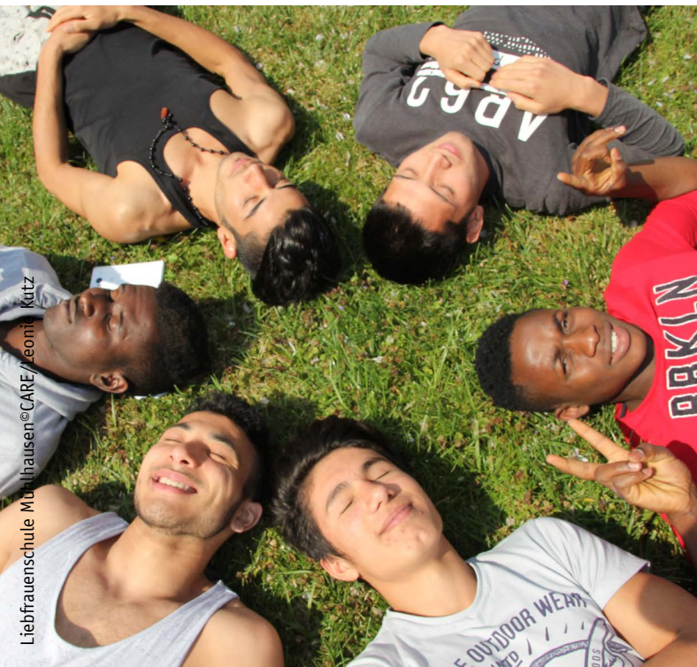
Liebfrauenkirche Maria Theresien