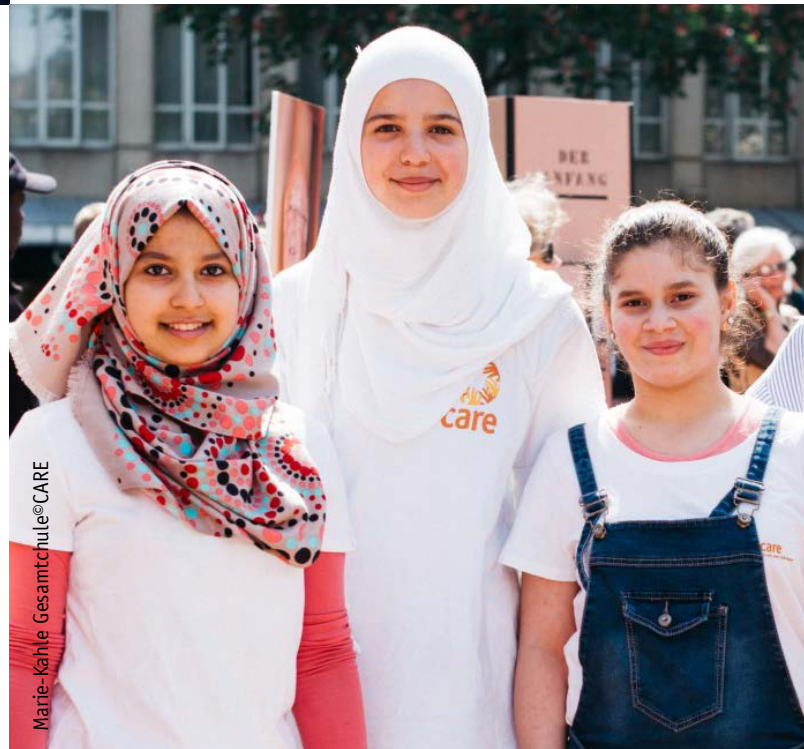
Marie-Käthe Gesamtschule

Motivation & Befähigung von Jugendlichen, für ihre Interessen einzutreten sowie eigene Initiativen & Projekte zu initiieren