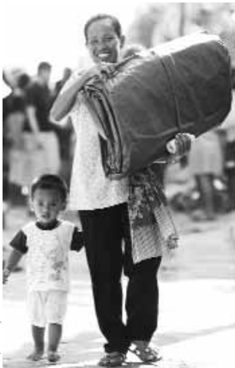
Eine Frau und ihr Kind haben eine Zeltplane von CARE erhalten.