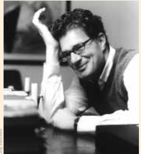
Drei, zwei, eins ... meins! Ein Candle-Light-Dinner mit Roger Willemsen, das den Ärmsten hilft.

Verpassen Sie die nächste Runde ab 15. August nicht! Aktuelle Informationen auf www.care.de