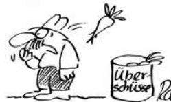
Abb. 2.9: Karikatur I.

©Greenpeace e.V., Illustrator: Stefan Hoch - ZCKR Netzwerk für gemeinnützige Kommunikation, Berlin